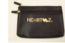
20 × 14 cm シッカリ生地のポーチです