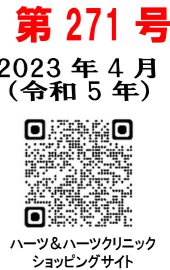
ハーツ&ハーツクリニックショッピングサイト

私たちの身体は、周波数でなりたっています。その周波数は、体中の情報を瞬時に脳に伝え、脳はその情報を瞬時に分析し、最適な対応策を全身に送り返します。主要な周波数は2030種類もあり、それぞれが乱れずに流れる事で情報がスムーズに伝わり、身体が本来持つ力を発揮させます。「ハーツ製品」には、その周波数を整える独自の「周波数加工®」…「ハーツ加工®」が施されています。いわば脳への「道しるべ」です。