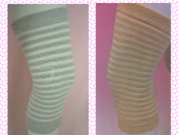
グレー アイボリー