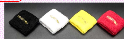
カラー:ブラック、ホワイト、イエロー、レッド

サイズ:フリー(目安横8cm×縦7.5cm) 素材:綿、アクリル、ナイロン、ポリウレタン