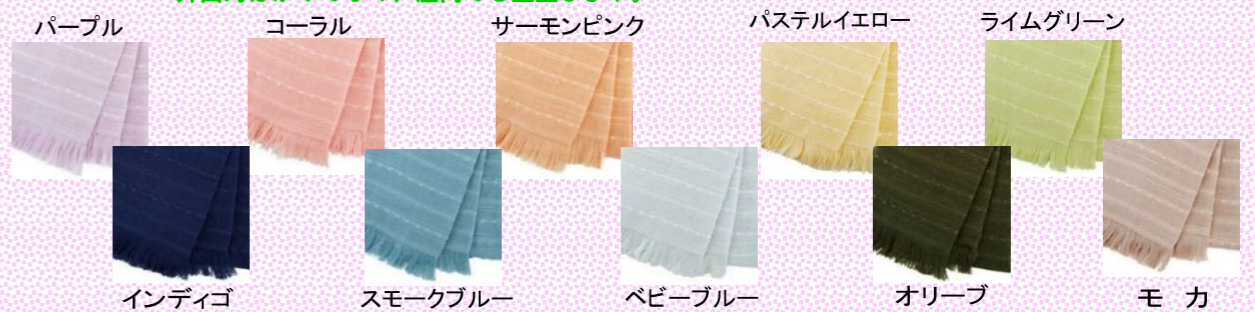
パープル コーラル サーマンピンク パステルイエロー ライムグリーン インディゴ スモークブルー ベビーブルー オリーブ モカ