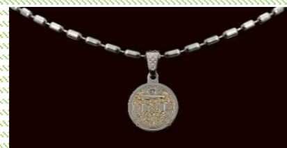
メタリックネックレスⅣ