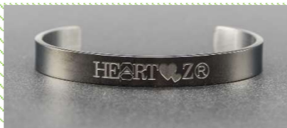
ルテニウムメッキ