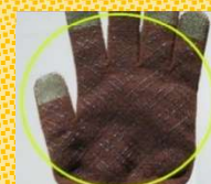
手のひら側に滑り止め処理