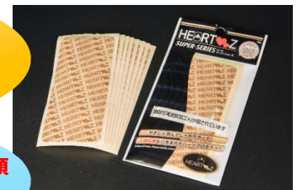
ベタ貼りタイプ 8シート(8シール)入り