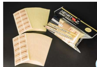
レギュラータイプ 徳用100シート(1000シール)入り