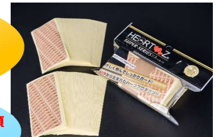
ベタ貼りタイプ 徳用100シート(100シール)入り