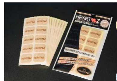
レギュラータイプ 8シート(80シール)入り